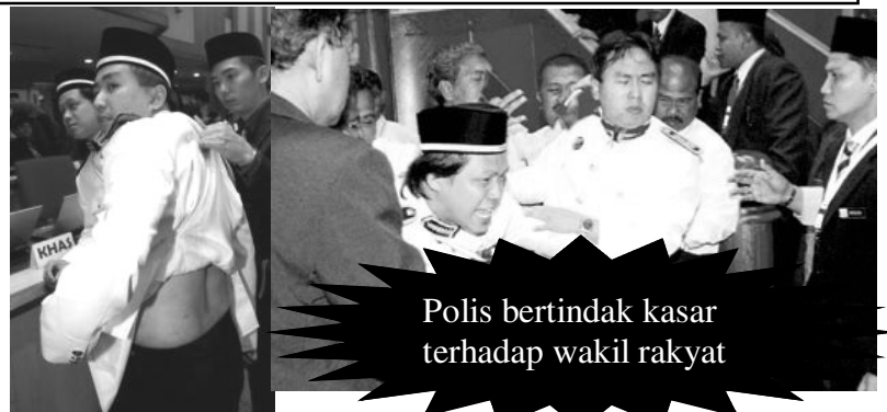
Polis bertindak kasar terhadap wakil rakyat

ADUN Jelapang yang digantung dan dihalau keluar oleh Speaker YB Sivakumar cuba merampas kuasa dengan cuba membuat pengumuman melantik Speaker baru - Ganesan, walaupun YB Sivakumar, Speaker yang sah masih berada di tempat duduk Yang Dipertua.