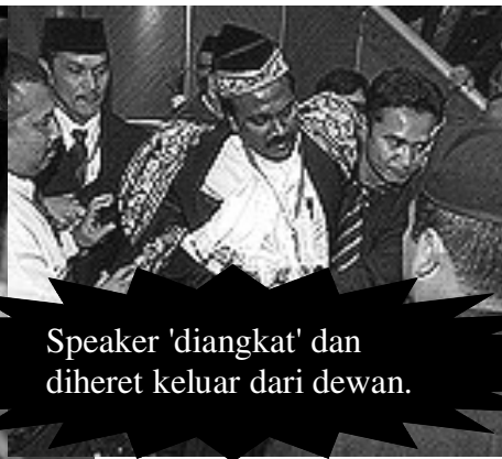
Speaker 'diangkat' dan diheret keluar dari dewan.