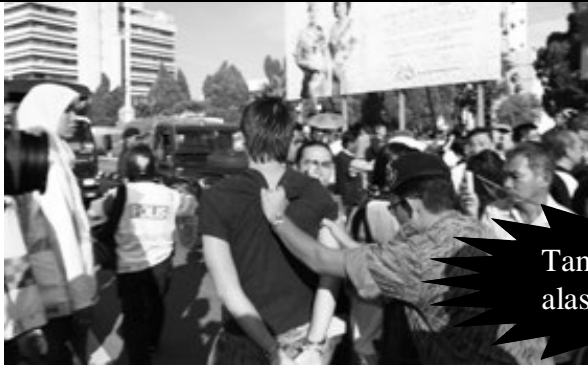
Tangkapan tanpa alasan munasabah

69 orang termasuk 10 ADUN dan ahli parlimen Pakatan Rakyat telah ditahan di sekitar DUN Perak sewaktu sidang dewan sedang berlangsung tanpa sebarang alasan yang munasabah.